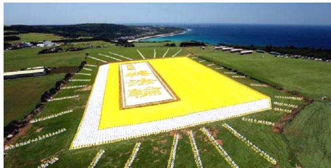
■ 2009 年 5 月 9 日，6000 多名台湾法轮功学员集体炼功，排演《转法轮》一书，贺大法传世十七周年。

● 弘传世界 各国褒奖 法轮功已弘传世界 114 个国家和地区，受到世界人民的爱戴和尊敬，获得各国政府褒奖、支持议案信函 3000 多项。法轮功书籍被译成 30 多种语言，在全世界出版发行，并可从网上免费下载。