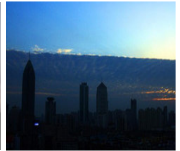
11 月 20 日下午 17 点左右，湖北武汉出现阴、阳两重天平分秋色的奇观。

北京时间 22 日 16 时 1 分 15 秒，湖北省秭归县发生 4.1 级地震。秭归、兴山、巴东震感强烈，部分老房出现裂缝。虽然三峡大坝未受影响，但是这纯粹是巧合吗？