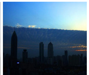
11 月 20 日下午 17 点左右，湖北武汉出现阴、阳两重天平分秋色的奇观。

北京时间 22 日 16 时 1 分 15 秒，湖北省秭归县发生 4.1 级地震。秭归、兴山、巴东震感强烈，部分老房出现裂缝。虽然三峡大坝未受影响，但是这纯粹是巧合吗？