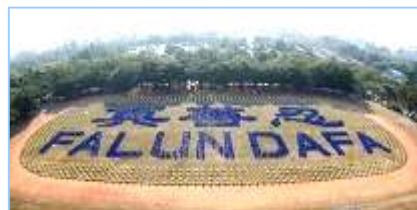
2008 年 12 月，近 3000 名法轮功学员在台湾炼功排字。

“前几年看了中央电视台报导的‘天安门自焚’事件后，非常震惊，海外各大媒体纷纷报导这一事件，没多久，国际教育发展组织发表了一份声明：‘天安门自焚’事件是中国政府一手导演的。当我详细看了‘自焚’事件的全部慢镜头后才明白，原来共产党竟然用这种杀人害命的方式迫害法轮功，欺骗老百姓，它还有什么坏事做不出来呢！特别是最近看到大纪元推出的《九评共产党》后才恍然大悟，真正看清了共产党的真正面目。虽然我已经十多年没有和党组织联系，没有交过党费，算是自动退党。但我感觉还是应该明确的严正声明一下，从自己内心彻底全面的清除共产党的毒素，退出这个邪恶的政党。”