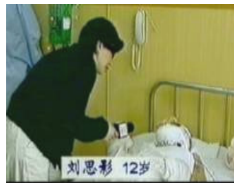
气管切开还能说、唱？记者采访不穿防护服，不戴口罩？

注：国际教育发展组织（IED）二零零一年八月在联合国会议上的正式声明指出：中共企图以今年一月二十三日天安门广场上的自焚事件来诬陷法轮功。我们得到一份录像分析表明，整个事件是由政府一手导演的。