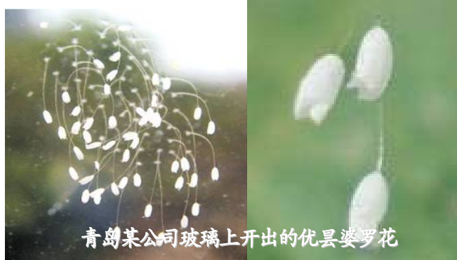
青岛某公司玻璃上开出的优昙婆罗花

的花朵一样有含苞、盛开、凋谢，这用唯物论根本解释不了。但是用修炼界的万物有灵的观点来看，却能够理解。其实现代科学通过研究已经发现了水