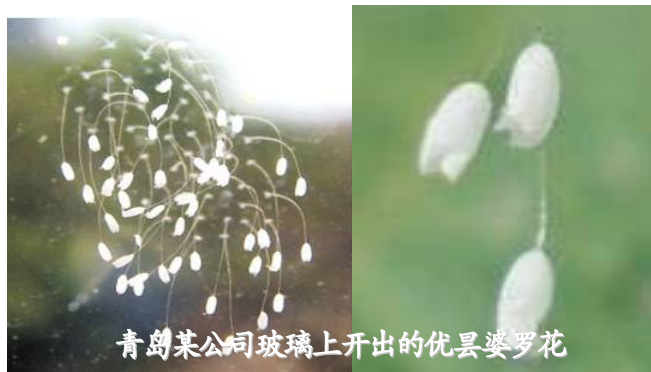
青岛某公司玻璃上开出的优昙婆罗花

的花朵一样有含苞、盛开、凋谢，这用唯物论根本解释不了。但是用修炼界的万物有灵的观点来看，却能够理解。其实现代科学通过研究已经发现了水