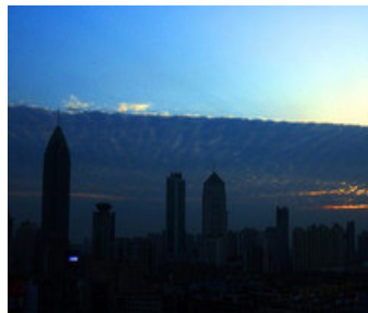
11月20日下午17点左右，湖北武汉出现阴、阳两重天平分秋色的奇观。