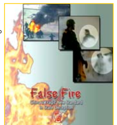
分析天安门自焚事件的纪录片《伪火》获第 51 届哥伦比亚国际电影电视节荣誉奖。