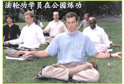
法轮功学员在公园炼功

正准备赴大陆对多年来法轮功学员受到的非人迫害进行独立调查。世界各国正在觉醒，世界人民包括大陆人民正在觉醒。