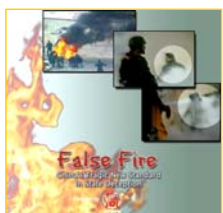
分析天安门自焚事件的纪录片《伪火》获第51届哥伦比亚国际电影节荣誉奖。

展组织（IED）在内的多个国际组织认定为虚假编造，并在联合国大会上强烈谴责中共当局的“国家恐怖主义行为”，指出其危害“远远超过任何其他形式的恐怖主义行动”。陈本人也被国际人权组织“追查国际”起诉通缉，从此不敢再踏进自由民主国家的土地。在信息严密封锁的中国大陆，中共假新闻制造的仇恨，却被装进千千万万不明真相