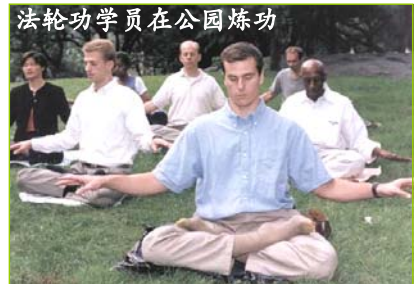
法轮功学员在公园炼功

正准备赴大陆对多年来法轮功学员受到的非人迫害进行独立调查。世界各国正在觉醒，世界人民包括大陆人民正在觉醒。