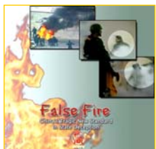
分析天安门自焚事件的纪录片《伪火》获第51届哥伦比亚国际电影节荣誉奖。

展组织（IED）在内的多个国际组织认定为虚假编造，并在联合国大会上强烈谴责中共当局的“国家恐怖主义行为”，指出其危害“远远超过任何其他形式的恐怖主义行动”。陈本人也被国际人权组织“追查国际”起诉通缉，从此不敢再踏进自由民主国家的土地。在信息严密封锁的中国大陆，中共假新闻制造的仇恨，却被装进千千万万不明真相