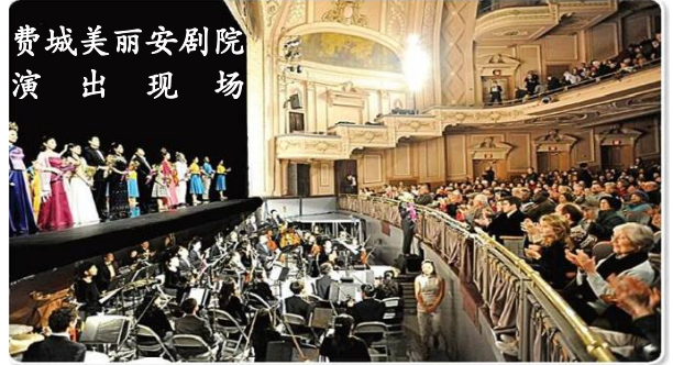
费城美丽安剧院 演出现场

由修炼法轮功的艺术家组成的神韵纽约艺术团、神韵国际艺术团和神韵巡回艺术团，2008年12月19日兵分三路，同时在美国费城、亚特兰大和迈阿密拉开了2009年全球巡演的序幕。预计今年的神韵晚会将巡回世界四大洲80个城市，演出约300场，刷新去年215场的纪录。