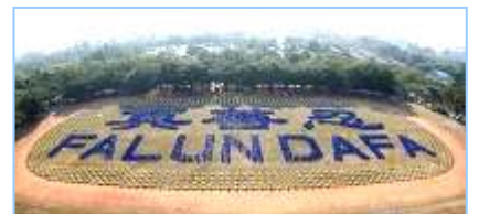
2008 年 12 月，近 3000 名法轮功学员在台湾炼功排字。

“前几年看了中央电视台报导的‘天安门自焚’事件后，非常震惊，海外各大媒体纷纷报导这一事件，没多久，国际教育发展组织发表了一份声明：‘天安门自焚’事件是中国政府一手导演的。当我详细看了‘自焚’事件的全部慢镜头后才明白，原来共产党竟然用这种杀人害命的方式迫害法轮功，欺骗老百姓，它还有什么坏事做不出来呢！特别是最近看到大纪元推出的《九评共产党》后才恍然大悟，真正看清了共产党的真正面目。虽然我已经十多年没有和党组织联系，没有交过党费，算是自动退党。但我感觉还是应该明确的严正声明一下，从自己内心彻底全面的清除共产党的毒素，退出这个邪恶的政党。”