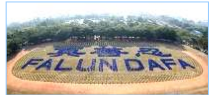
2008 年 12 月，近 3000 名法轮功学员在台湾炼功排字。

“前几年看了中央电视台报导的‘天安门自焚’事件后，非常震惊，海外各大媒体纷纷报导这一事件，没多久，国际教育发展组织发表了一份声明：‘天安门自焚’事件是中国政府一手导演的。当我详细看了‘自焚’事件的全部慢镜头后才明白，原来共产党竟然用这种杀人害命的方式迫害法轮功，欺骗老百姓，它还有什么坏事做不出来呢！特别是最近看到大纪元推出的《九评共产党》后才恍然大悟，真正看清了共产党的真正面目。虽然我已经十多年没有和党组织联系，没有交过党费，算是自动退党。但我感觉还是应该明确的严正声明一下，从自己内心彻底全面的清除共产党的毒素，退出这个邪恶的政党。”