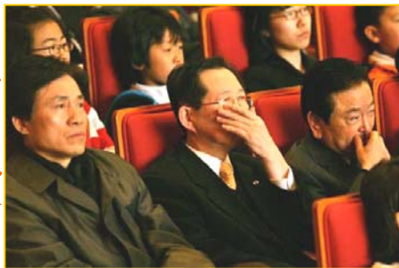
■ 神韵感动韩国大邱的铁汉男子