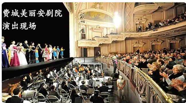
费城美丽安剧院 演出现场

由修炼法轮功的艺术家组成的神韵纽约艺术团、神韵国际艺术团和神韵巡回艺术团，2008 年 12 月 19 日兵分三路，同时在美国费城、亚特兰大和迈阿密拉开了 2009 年全球巡演的序幕。预计今年的神韵晚会将巡回世界四大洲 80 个城市，演出约 300 场，刷新去年 215 场的纪录。