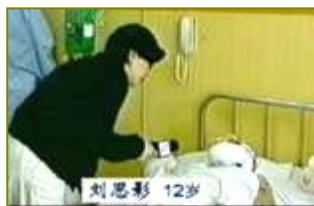
■ 气管切开还能说唱？无菌室里记者采访竟然不穿防护服没戴口罩。