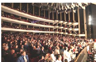
■ 加拿大渥太华国家艺术中心的四场演出，均是爆满。演出结束时全场观众起立致敬。