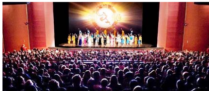
■ 神韵在华盛顿肯尼迪艺术中心的六场演出，场场爆满。周末场座无虚席，站票也一售而光。

上/神韵在韩国的 11 场演出场场爆满。性格坚韧的大韩男子也感动落泪。最后一场演出在热烈掌声中五次谢幕。 下/日本东京的演出爆满。