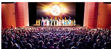
■ 神韵在华盛顿肯尼迪艺术中心的六场演出，场场爆满。周末场座无虚席，站票也一售而光。

上/神韵在韩国的 11 场演出场场爆满。性格坚韧的大韩男子也感动落泪。最后一场演出在热烈掌声中五次谢幕。 下/日本东京的演出爆满。