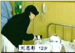
■气管切开还能说唱？ ■自焚者王进东，两腿 无菌室里记者采访竟然 不穿防护服没戴口罩。

这场漏洞百出、手法拙劣、缺乏基本医学常识的陷害法轮功的骗局，被包括国际教育发展组织