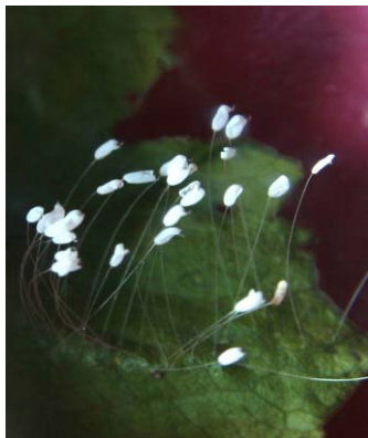
图为零八年秋开在山东德州某公司院内树叶上的优檀婆罗花。

在“优昙婆罗花”开的这个特殊历史时期，玛雅人的古老传说也奇迹般的得以兑现，十三块水晶头骨失而复聚。大祭司阿莱坚德罗称：水晶头骨复聚，是神回来的时候！释迦牟尼曾经预言：在二千五百年后，转轮圣王将下世正法，并要洪传一种不绝世缘的修炼法门。