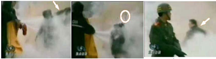
1.刘头部受重击 2.击打后飞出的重物 3.打击者仍保持用力姿势

中央电视台声称法轮功创始人编造身世更改生日，说自己是“释迦牟尼转世”，但实际情况是文革