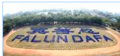
2008 年 12 月，近 3000 名法轮功学员在台湾炼功排字。

“前几年看了中央电视台报导的‘天安门自焚’事件后，非常震惊，海外各大媒体纷纷报导这一事件，没多久，国际教育发展组织发表了一份声明：‘天安门自焚’事件是中国政府一手导演的。当我详细看了‘自焚’事件的全部慢镜头后才明白，原来共产党竟然用这种杀人害命的方式迫害法轮功，欺骗老百姓，它还有什么坏事做不出来呢！特别是最近看到大纪元推出的《九评共产党》后才恍然大悟，真正看清了共产党的真正面目。虽然我已经十多年没有和党组织联系，没有交过党费，算是自动退党。但我感觉还是应该明确的严正声明一下，从自己内心彻底全面的清除共产党的毒素，退出这个邪恶的政党。”