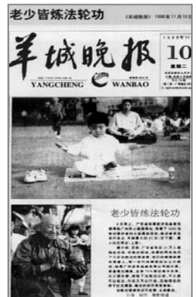
■中共迫害前大陆媒体的公正报道——《老少皆炼法轮功》

1999年7月，中共江氏集团出于妒忌和极度偏执，全面操控媒体抹黑法轮功，欺骗世界，为迫害制造借口。经过法轮功学员9年多坚持不懈地讲清真相，如今人心渐明。法轮大法至今已洪传80多个国家和地区，受到世界人民的欢迎和喜爱，修炼者上亿。迄今为止，法轮大法已获得各国政府褒奖近3000项。法轮大法的主要著作