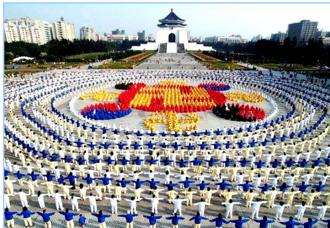
■ 2005 年 12 月 25 日，台湾 4000 多名法轮功学员集体炼功，排组法轮图形。

● 洪传世界 法轮功迄今已洪传世界 80 多个国家和地区，受到世界人民的爱戴和尊敬。因李洪志先生和法轮大法对人类身心健康作出的杰出贡献，已获得各国政府褒奖、支持议案信函超过 2977 项。法轮功书籍被译成 30 多种语言。自 2000 年起，李洪志先生连续四年被提名诺贝尔和平奖。