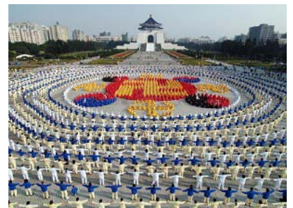
二零零五年十二月二十五日台湾四千名学员排组法轮图形