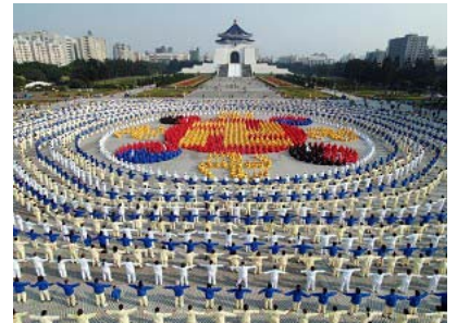
二零零五年十二月二十五日台湾四千名学员排组法轮图形

甚至全世界所有国家的政府高层没有不知道法轮功的，尤其民主社会一说到人权，往往都会提及法轮功在中国被残酷的迫害。以至于中共在国际社会上越来越臭。