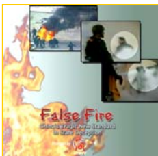
分析天安门自焚事件纪录片《伪火》获第51届哥伦布国际电影节荣誉奖

中央电视台自焚遭殃后，尽管中共邪党下令压制对此事的报道和讨论，但网上仍出现很多对此事的评论。一般来说，任何一个地方发生火灾或其它灾祸，民众都会深表同情，可是此次大陆民众对此事的反应却多是津津乐道。可见大陆公众对这个遭殃电视台是如何的深恶痛绝。