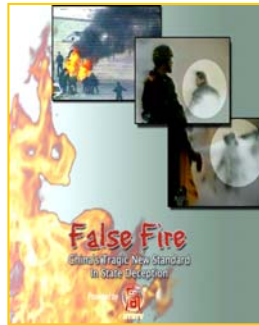
分析天安门自焚事件纪录片《伪火》获第51届哥伦布国际电影节荣誉奖

灾，大火燃烧了近六个小时，建筑里面十几层的中庭已经坍塌。火灾是在失火楼西南角的空地上燃放礼花弹，导致央视文化中心起火。这是邪党喉舌媒体的一次玩火自焚。