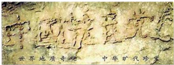
2002 年贵州平塘县掌布乡发现了距今二亿七千万年的“藏字石”，巨石断面上自然形成的六个大字“中国共产党亡”。图片和报道网上可查。

或许曾经有人与您擦肩而过，却善意的告诉您“法轮大法好”；或许曾经有人与您萍水相逢，却真诚的告诉您“三退（退出党团队）保平安”。这样的机会，润物无声，对您无欲无求，您可曾给自己一个机会，去倾听那真诚善意的呼唤。