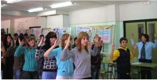
师生们一起学炼第二套功法——法轮桩法

有五套功法，与现代竞技体育不同的是其动作舒缓，甚至打坐不动，可令新陈代谢减缓，细胞分裂次数减少，生命得到自然发展，不象搞竞技体育的人那样显的早熟，衰老得快。而且与一般的体操锻炼也不同，法轮大法对人的心灵、思想升华有益，因为他用“真、善、忍”的标准要求炼功人，注重美德的育化，有助于专心学习。你们就象洁白无皱的纸，纯净待放的花，现在认识起法轮大法，会有美好未来……。