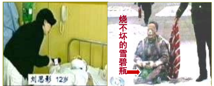
■ 气管切开还能说唱？

似乎早有准备，近距离、远距离各种镜头一应俱全。之后中央电视台还去了医院采访。被割开了气管的小女孩居然能够口齿清楚地唱歌。中央电视台利用民众的同情心造假欺骗、煽动仇恨，为中共邪党加剧对法轮功民众的迫害推波助澜，导致难以计数的法轮功修炼者被非法关押、劳教、判刑，被暴力洗脑、酷刑折磨，甚至迫害致死。