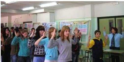
师生们一起学炼第二套功法——法轮桩法

有五套功法，与现代竞技体育不同的是其动作舒缓，甚至打坐不动，可令新陈代谢减缓，细胞分裂次数减少，生命得到自然发展，不象搞竞技体育的人那样显的早熟，衰老得快。而且与一般的体操锻炼也不同，法轮大法对人的心灵、思想升华有益，因为他用“真、善、忍”的标准要求炼功人，注重美德的育化，有助于专心学习。你们就象洁白无皱的纸，纯净待放的花，现在认识起法轮大法，会有美好未来……。