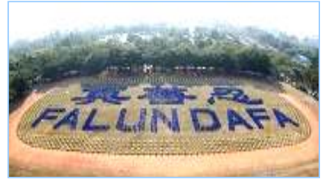
2008年12月，近3000名法轮功学员在台湾炼功排字。

后才恍然大悟，真正看清了共产党的真正面目。虽然我已经十多年没有和党组织联系，没有交过党费，算是自动退党。但我感觉还是应该明确地严正声明一下，从自己内心彻底全面地清除共产党的毒素，退出这个邪恶的政党。”