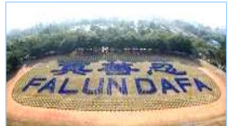
2008年12月，近3000名法轮功学员在台湾炼功排字。

后才恍然大悟，真正看清了共产党的真正面目。虽然我已经十多年没有和党组织联系，没有交过党费，算是自动退党。但我感觉还是应该明确地严正声明一下，从自己内心彻底全面地清除共产党的毒素，退出这个邪恶的政党。”