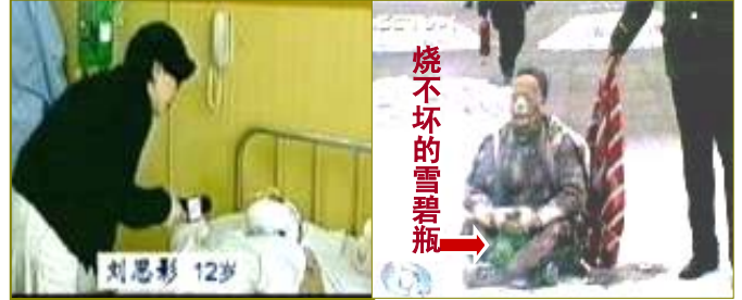
■ 气管切开还能说唱？

似乎早有准备，近距离、远距离各种镜头一应俱全。之后中央电视台还去了医院采访。被割开了气管的小女孩居然能够口齿清楚地唱歌。中央电视台利用民众的同情心造假欺骗、煽动仇恨，为中共邪党加剧对法轮功民众的迫害推波助澜，导致难以计数的法轮功修炼者被非法关押、劳教、判刑，被暴力洗脑、酷刑折磨，甚至迫害致死。