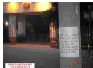
滁州市政府门前的退党消息