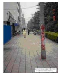
合肥市“神灭共产党”标语