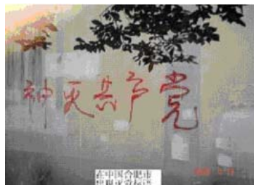
合肥市“神灭共产党”标语