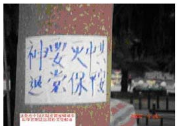
蚌埠市科学宫附近的退党标语