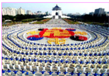
零五年十二月二十五日，台湾四千名学员排组法轮图形。

如今，李姨最大的心愿就是同胞们都能早日明真相，能找本《转法轮》读一读，自己来辨别：谁善谁恶，到底是谁在欺骗人民、散布“邪说”。（文／悠悠）