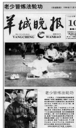
■中共迫害前大陆媒体的公正报道——《老少皆炼法轮功》

她想说，法轮功真是好啊！即使你不同意，也请你尊重他，让别人拥有自己的信仰吧！还有，把你的心打开一些吧！你会发现很多的可能性。◇