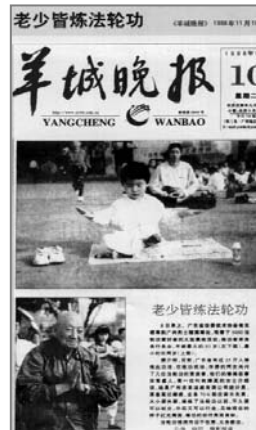
■中共迫害前大陆媒体的公正报道——《老少皆炼法轮功》

她想说，法轮功真是好啊！即使你不同意，也请你尊重他，让别人拥有自己的信仰吧！还有，把你的心打开一些吧！你会发现很多的可能性。◇