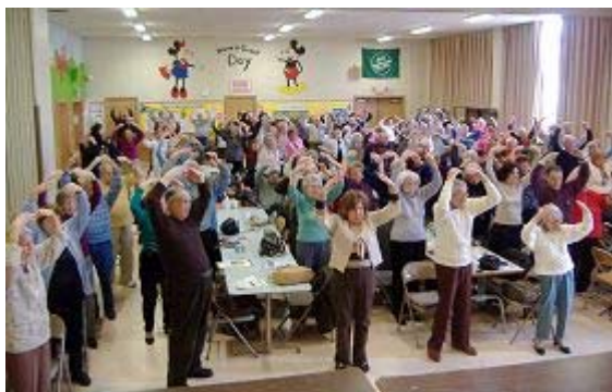
俱乐部的老人们踊跃学炼法轮功

俱乐部成员们提问相当踊跃，了解了法轮功和发生在中国的迫害真相后，他们都希望学炼法轮功，并谴责中共对法轮功和对人权信仰的迫害。