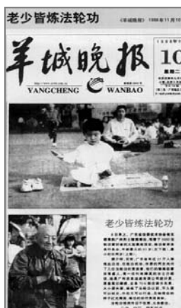
■ 中共迫害前大陆媒体的公正报道 ——《老少皆炼法轮功》

法轮功以真、善、忍为修炼原则，包括五套缓慢优美的功法动作，使修炼者身心健康，并能达到开智开慧。