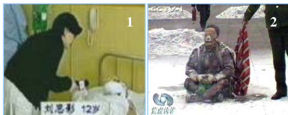
1. 气管切开还能说唱 2. 装汽油的雪碧瓶完好无损