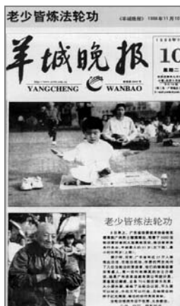
■ 中共迫害前大陆媒体的公正报道 ——《老少皆炼法轮功》

法轮功以真、善、忍为修炼原则，包括五套缓慢优美的功法动作，使修炼者身心健康，并能达到开智开慧。