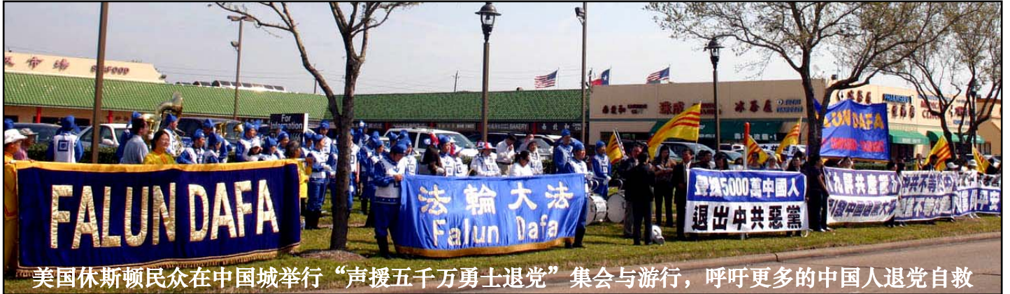
美国休斯顿民众在中国城举行“声援五千万勇士退党”集会与游行，呼吁更多的中国人退党自救