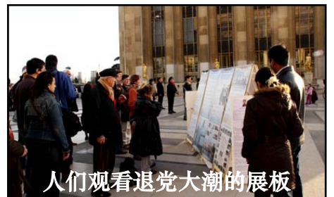
人们观看退党大潮的展板