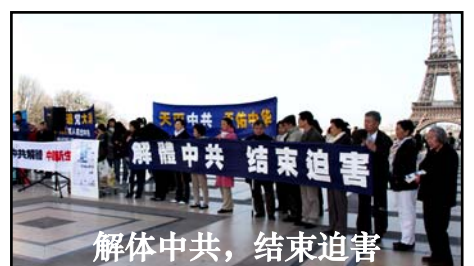
解体中共，结束迫害