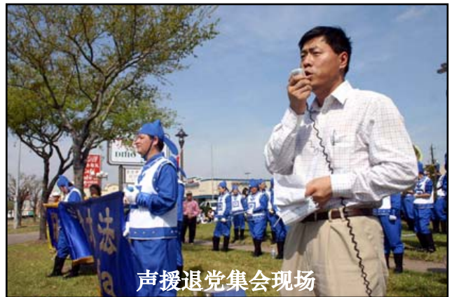
声援退党集会现场

【明慧网】二零零九年三月二十一日，美国休斯顿民众在中国城举行“声援五千万勇士退党”集会与游行，呼吁更多的中国人珍惜时机，退出中共邪党的党团队及相关组织，抹去兽记，远离邪恶，自救并救人。这是休士顿民众第二次举办“民众声援五千万退党”活动。迄今为止，中国民众“三退”人数已达五千一百多万。退党大游行吸引了当地社团、达拉斯、奥斯汀的退党服务中心义工加入。