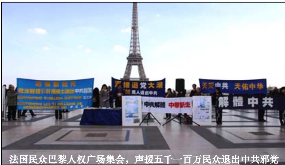
法国民众巴黎人权广场集会，声援五千一百万民众退出中共邪党

酷迫害和给全体中国人民带来的深重灾难，共同庆祝五千一百万勇士退出中共及其相关组织。