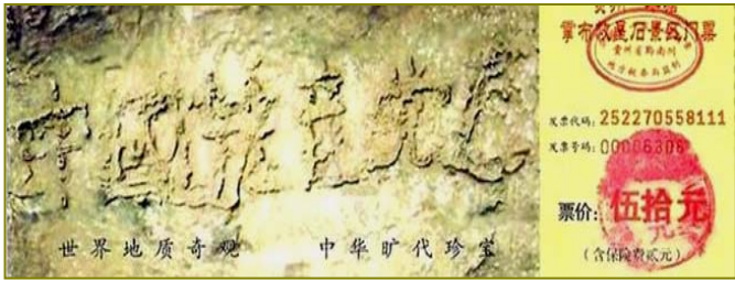
2002 年 6 月，在贵州省平塘县掌布乡发现了

2009 年 2 月，由联合国推动的群体灭绝案法庭在柬埔寨首都正式开庭，以战争罪、反人类罪、酷刑及谋杀罪指控，开始对前波尔布特共产党政府的五个高官进行审判，这消息成为大陆媒体网站上的热议。而人间和天理对中共的审判也将不远了。然而当人们加入中共组织时都发过毒誓——把生命献给其组织，那么就会在天灭中共时成为其牺牲品，所以在很多古代的预言中都提到了：“天灭中共、三退保命”，只有声明退出中共的组织才能废除毒誓，才能在大劫难中保住性命。所以说三退根本不是“政治”范畴的问题，而是我们能否用良知选择正义、远离中共邪恶的政治，用智慧为自己生命和未来负责的问题。