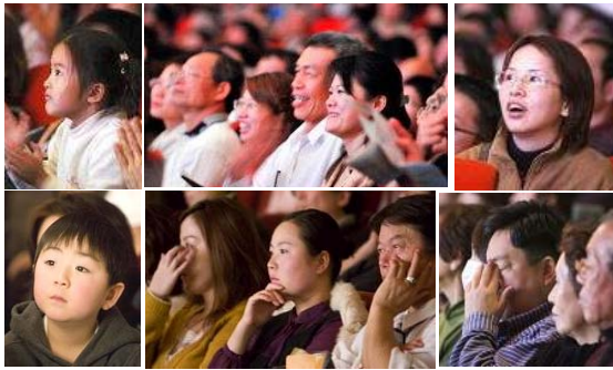
■ 神韵晚会华美灵动，内涵悠远，深深触动韩国（上图）和日本（下图）观众。

韩国十四位国会议员及大邱、首尔两大城市的多位市长、律师及艺术界、文化界等知名人士纷纷为神韵艺术团发表贺辞，盛赞神韵晚会是世界一流演出。日本前首相海部俊树等多位国会议员及各界名人纷纷致辞，赞赏神韵演出世界一流，并祝贺演出圆满成功。