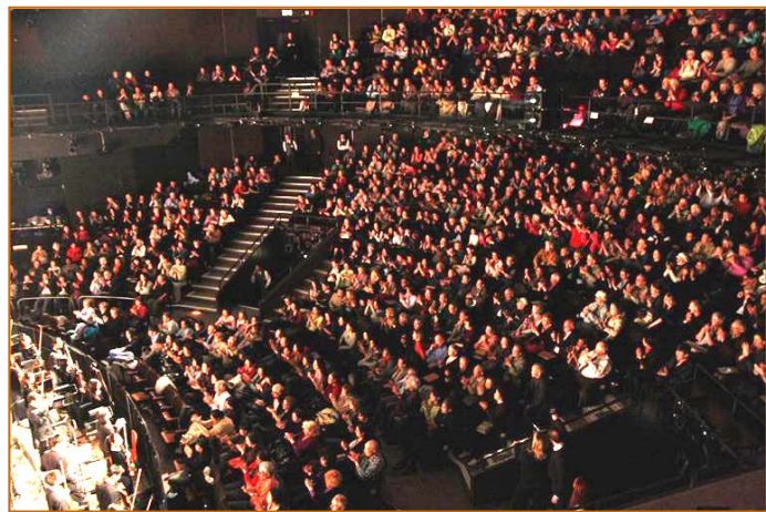
■以矜持内敛著称的伦敦人被神韵晚会全善全美的艺术呈现和深邃内涵感动，神韵在英国再爆满，创票房奇迹。