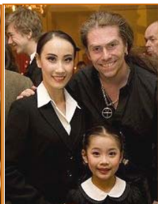
■中图：台湾观众为神韵喝彩。右图：瑞典各政党议员、知名艺术家3月向光临本地的神韵艺术团致贺，图为对神韵倍加赞赏的瑞典音乐家马格努斯·若森与神韵演员合影。

法师父和法轮大法，每天诚心念“法轮大法好”“真善忍好”，顺应天象“三退”（退出中共党团队），就会有奇迹。于是我们全家都“三退”了。