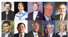
■丹麦、美国乔治亚州、俄州政要3月致贺信祝神韵演出成功。