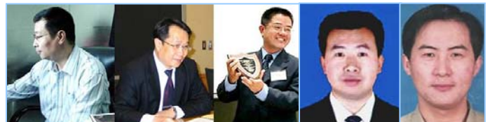
部分为法轮功学员无罪辩护的律师（左起）：

被誉为“中国良心”、为停止迫害法轮功而三次公开上书胡温的人权律师高智晟，遭中共残酷迫害，至今仍被非法关押。