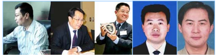
部分为法轮功学员无罪辩护的律师（左起）：

被誉为“中国良心”、为停止迫害法轮功而三次公开上书胡温的人权律师高智晟，遭中共残酷迫害，至今仍被非法关押。