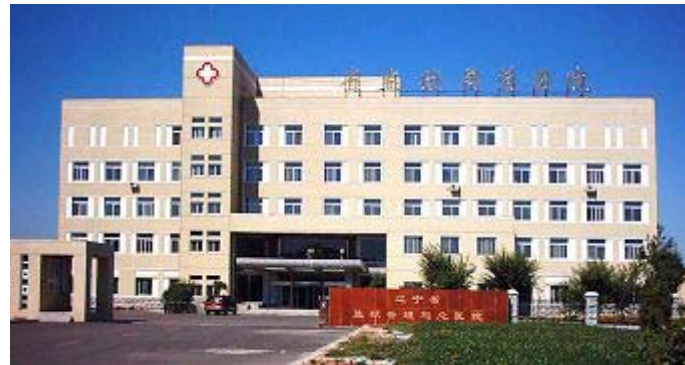
辽宁省监狱管理局总医院（简称“监管医院”）