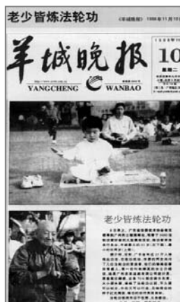
■中共迫害前大陆媒体的公正报道——《老少皆炼法轮功》

法轮功以真、善、忍为修炼原则，包括五套缓慢优美的功法动作，使修炼者身心健康，并能达到开智开慧。