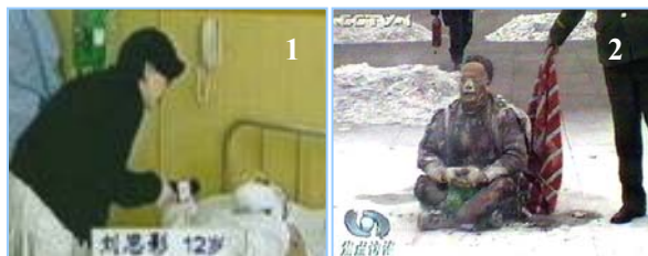
1. 气管切开还能说唱 2. 装汽油的雪碧瓶完好无损