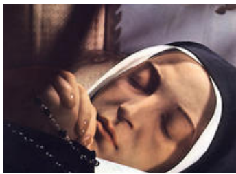
修女圣白娜戴特的面容 历经百年仍栩栩如生

这位叫圣白娜戴特的修女已经死了122年之久，而且已经被埋葬了。她的身体在30年前被发现的，也就是就在教堂的高层干事决定要检查她的身体之后。她的身体至今依然被保存的很好，如果你去法国 Lourdes 的话