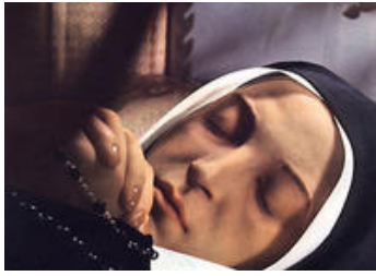
修女圣白娜戴特的面容 历经百年仍栩栩如生

这位叫圣白娜戴特的修女已经死了122年之久，而且已经被埋葬了。她的身体在30年前被发现的，也就是就在教堂的高层干事决定要检查她的身体之后。她的身体至今依然被保存的很好，如果你去法国 Lourdes 的话