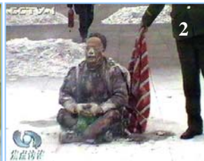
1. 气管切开还能说唱 2. 装汽油的雪碧瓶完好无损