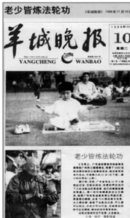
■中共迫害前大陆媒体的公正报道——《老少皆炼法轮功》

她想说，法轮功真是好啊！即使你不同意，也请你尊重他，让别人拥有自己的信仰吧！还有，把你的心打开一些吧！你会发现很多的可能性。