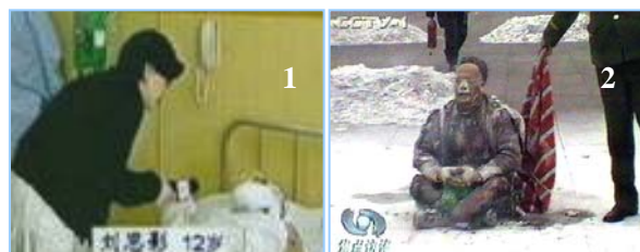
1. 气管切开还能说唱 2. 装汽油的雪碧瓶完好无损

中央电视台此次自焚只是报应的一个前兆。为中共邪党充当喉舌骗人害人的所谓“新闻工作者”们应该好好反省，停止对法轮功和无辜民众的造谣构陷，退出中共邪党，选择一条自新之路。