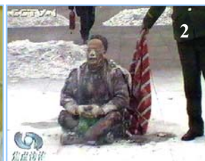
1. 气管切开还能说唱 2. 装汽油的雪碧瓶完好无损