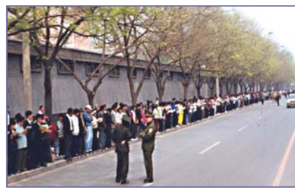
法轮功学员文明安静，警察不用维持秩序，在一旁聊天。学员背后不是中南海红墙，所谓的“围攻中南海”根本不存在。

4•25 当晚，江泽民出于妒忌，强行推翻政府总理的开明决定，把和平上访歪曲成“围攻中南海”，并于99年7月开始全面迫害法轮功。