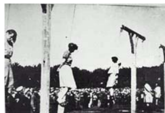
照片：纽伦堡国际战犯法庭经过对纳粹集中营死亡护士组在对犹太人的种族灭绝中所犯罪行的认定，于1946年对她们执行死刑。

在第二次世界大战结束后的纽伦堡国际军事法庭上，除第一轮对级别高的战犯审判外，在以后举行的十二轮审判中，主要起诉的是为德国纳粹帮凶的企业家、军事人员、集中营看守、医生等等。一些被纳粹强迫执行纳粹命令的人员也被判了绞刑，纽伦堡国际军事法庭永远否决了罪犯