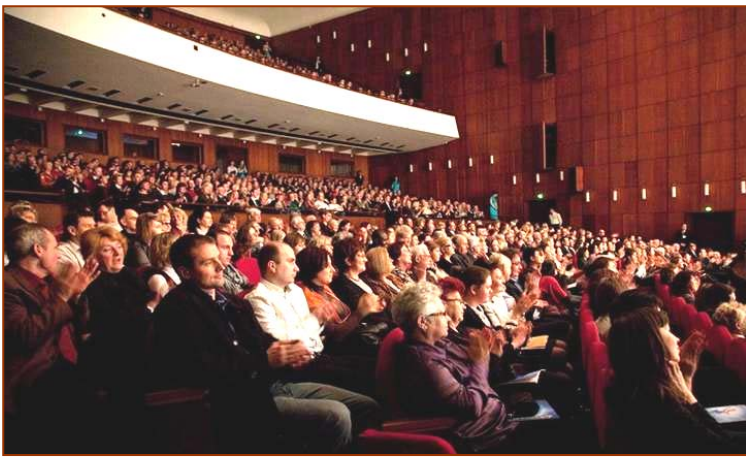
波兰罗兹大剧院爆满，观众对神韵晚会报以热烈的掌声。