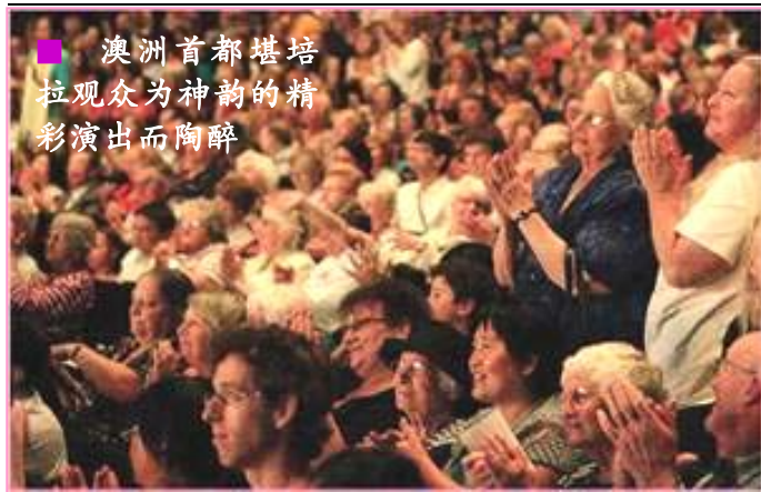
■ 澳洲首都堪培拉观众为神韵的精彩演出而陶醉