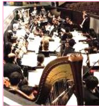
中西合璧神韵艺术团 乐队奏出旷世天音

■ 神韵艺术团乐队以西洋管弦乐器为基础，加上传统中国乐器如二胡、琵琶、古筝、笛子等，使演奏乐曲既发挥西洋管弦乐潜能又富中国民族特色。