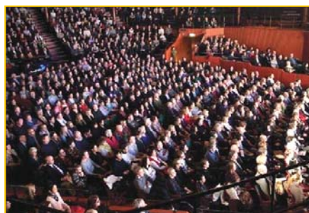
▲瑞典斯德哥尔摩Cirkus大剧场爆满。▶澳洲堪培拉观众为神韵倾倒。