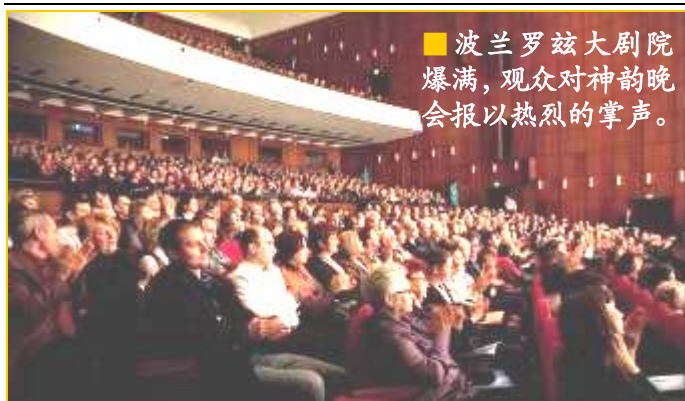
■波兰罗兹大剧院爆满，观众对神韵晚会报以热烈的掌声。

■神韵艺术团起在澳洲展开为期近一月的巡回演出。澳洲政要们向神韵艺术团发来热情的贺信、贺电。