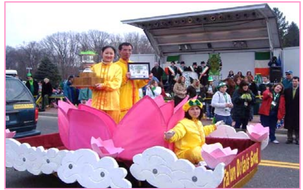
纽约长岛大游行 法轮功队伍获头奖

美国纽约长岛法轮功学员3月14日和15日参加了四个由不同地区十二个镇组织的圣派翠克（St. Patrick）节游行，受到主办单位的好评及各地观众的热烈欢迎。游行评委会负责人将游行的头奖奖状和最佳彩车奖的奖杯颁发给了法轮功学员。