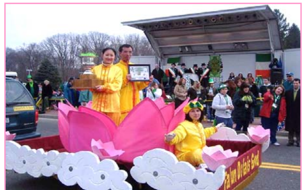
纽约长岛大游行 法轮功队伍获头奖

美国纽约长岛法轮功学员3月14日和15日参加了四个由不同地区十二个镇组织的圣派翠克（St. Patrick）节游行，受到主办单位的好评及各地观众的热烈欢迎。游行评委会负责人将游行的头奖奖状和最佳彩车奖的奖杯颁发给了法轮功学员。