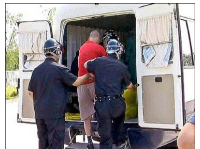
中共使用的死刑执行车外观与一般警用厢型车无异。

古云：“天理昭昭，善恶有报”。二战后德国纽伦堡大审判，杀人刽子手都难逃法网。同样，对无辜法轮功学员的残酷迫害，这批丧心病狂的加害者，最后都将在正义的谴责、审判与严惩中偿还罪恶。德国纳粹集中营打手的下场，也将是那些执行活摘器官者的下场。◇