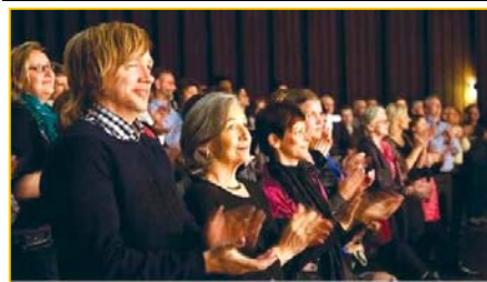
▲ 意犹未尽的挪威观众。▶ 3月25日,台湾的39场神韵演出圆满落幕。民进党主席蔡英文致花篮祝贺。