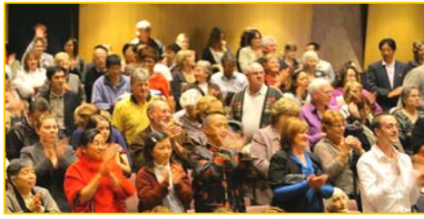
■ 澳洲观众向神韵精彩的演出鼓掌致谢