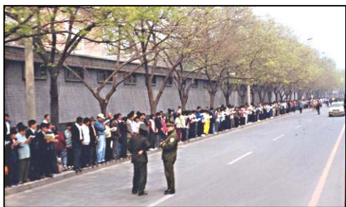
■1999年4月25日，万名法轮功学员上访，秩序井然。

4.25 那天早晨，中南海周围本来已经戒严布控，不久出现了惊人一幕：警察取消路障，先把大法学员的队伍从马路东口引到西口；然后又指挥着队伍，由北向南缓缓地向着中南海正门行进。同时，迎面浩浩荡荡的另一队学员正由南向北，朝着目击者这一队伍而来。两行队伍正好在中南海正门相遇