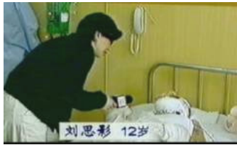
气管切开还能说、唱？记者采访不穿防护服、不戴口罩？