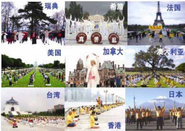
图：不同族裔的 修炼者在炼功

● 洪传世界 法轮功已洪传世界 80 多个国家和地区，受到世界人民的爱戴和尊敬。因李洪志先生和法轮大法对人类身心健康作出的杰出贡献，获得各国政府褒奖、支持议案信函超过 2977 项。法轮功书籍被译成 30 多种语言全球发行。