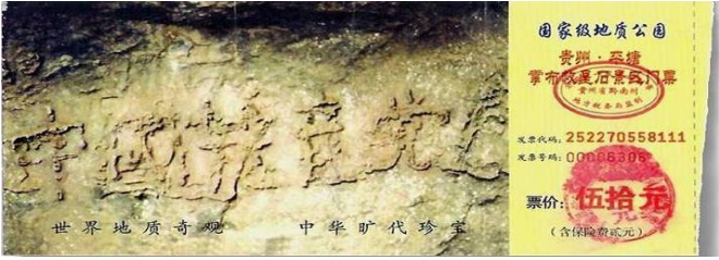
▲掌布风景区门票上“中国共产党亡”的照

贵州“藏字石”风景区的门票（下图）。可见天意不可违，“天灭中共，三退保命”绝非戏言、切莫迟疑！