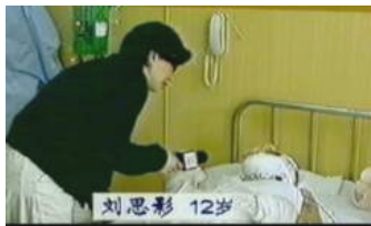
气管切开还能说、唱？记者采访不穿防护服、不戴口罩？