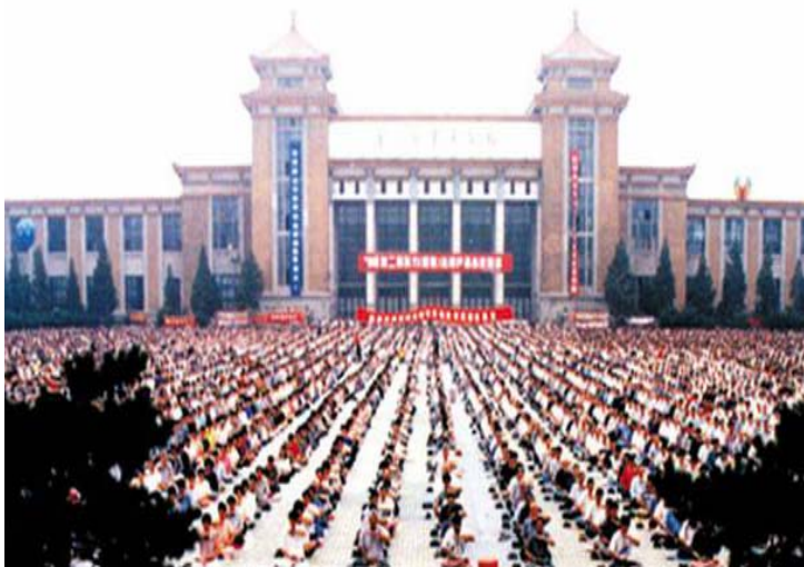
▼历史图片：九九年之前沈阳万人大型集体炼法轮功场面