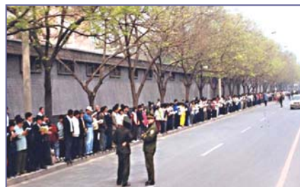
法轮功学员文明安静，警察不用维持秩序，在一旁聊天。学员背后不是中南海红墙，所谓的“围攻中南海”根本不存在。

4月18日至24日，部份天津法轮功学员前往天津教育学院及相关机构反映实情。23、24日，天津市公安局动用防暴警察殴打和非法逮捕法轮功学员，致学员流血受伤，45人被抓。学员在天津市政府被告知：公安部介入了这个事件，你们去北京才能解决问题。