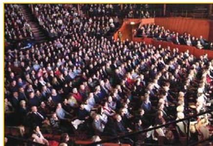
▲ 瑞典斯德哥尔摩 Cirkus 大剧场爆满。▶ 澳洲堪培拉观众为神韵倾倒。