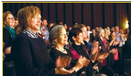
▲ 意犹未尽的挪威观众。▶ 3月25日,台湾的39场神韵演出圆满落幕。民进党主席蔡英文致花篮祝贺。