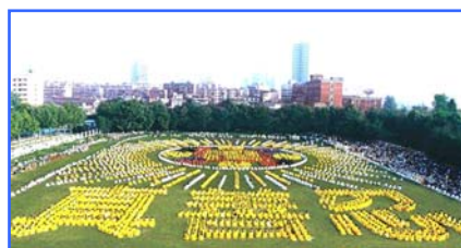
▲ 5000 多名武汉法轮功学员集体炼功，排组法轮图形和“真善忍”。(1997)

● 法轮大法至今已洪传世界 80 多个国家和地区，获得各国政府褒奖、支持议案、信函超过 2977 项。法轮大法的主要著作《转法轮》已被译成 30 多种文字，在全世界出版发行。